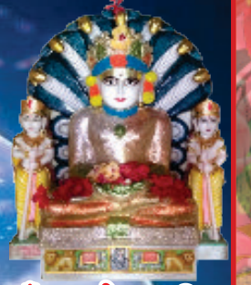
ઐકાર શ્રી જીરાઉલા પાર્શ્વનાથ ભગવાન